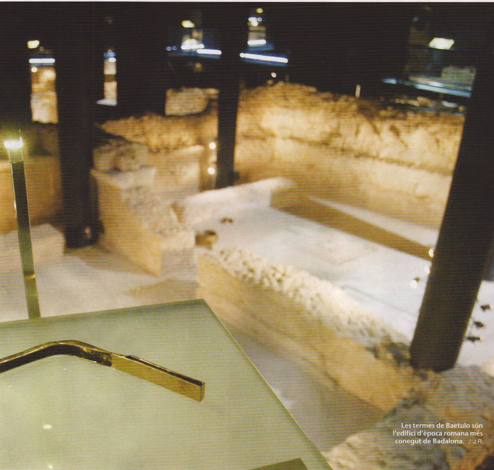
Les termes de Baetulo són l'edifici d'època romana més conegut de Badalona. / J.F.

lògic s'hi pot veure el Decumanus Maximus, que era el carrer principal en direcció est-oest, i l'encreuament amb el Cardo Maximus i dos cardo minor , carrers que van de muntanya a mar. Ens trobem així al centre de la ciutat romana, al fòrum, espai on s'alça un edifici públic de grans dimensions que devia allotjar el mercat. Les illes de cases que formen els carrers inclouen un seguit d'edificis públics, com ara el conjunt de les termes, i privats, amb habitatges i botigues. «La trama