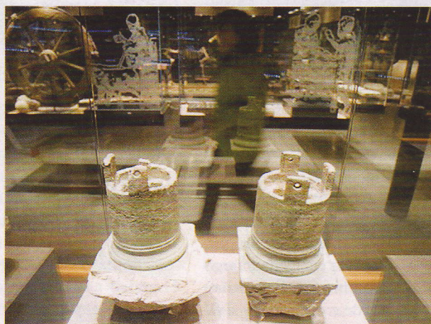
A l'esquerra un tram de carrer amb la seva claveguera. De dalt a baix, àmfores romanes trobades a Baetulo, esteles funeràries amb grafies ibèriques, habitacions i botigues del recinte arqueològic i les pollegueres de bronze d'una de les portes de la muralla.