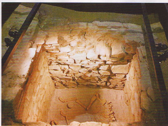
Recreació d'un dels pous que el metro va fer aflorar.

suma de descobertes arqueològiques que es van iniciar a principi del segle XX com a conseqüència de la necessitat de Badalona de créixer. Els primers intents d'urbanització del que havien estat els camps de conreu de la Torre Vella, una casa pairal amb restes que daten del segle XIV, són previs a la Guerra Civil. Tot i això, Badalona tenia constància del seu passat romà des del segle XVIII, segons explica l'arqueòloga Pepita Padrós. Per aquelles dates es fan algunes troballes. Durant les primeres dècades del segle XX, l'Institut d'Estudis Catalans fa excavacions a la recerca del passat romà de Badalona. L'any 1927 es localitza un habitatge d'època romana, la casa dels Dofins, una domus de final del segle I que ara està museïtzada i es pot visitar. L'excavació de l'espai que ocupa ara el Museu de Badalona s'inicia durant els anys cinquanta del segle passat. L'any 1954 es va fer el descobriment de les