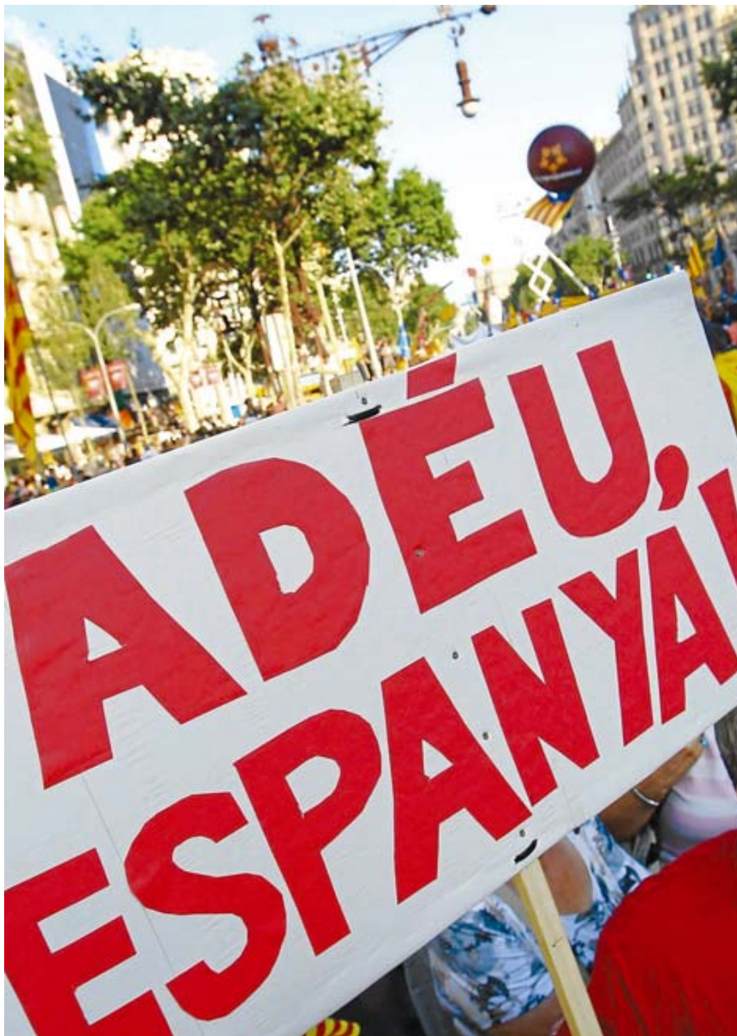
Els partidaris de trencar amb Espanya augmenten.

El 1934, però, qui escriurà una obra en molts aspectes profètica serà el filòsof Alexandre Deulofeu, titulada Catalunya i l'Europa futura . Deulofeu pronostica una federació mundial de pobles lliures i afirma que així com la desintegració dels grans imperis europeus ha permès aparèixer nous països, Catalunya sorgirà d'un procés similar.