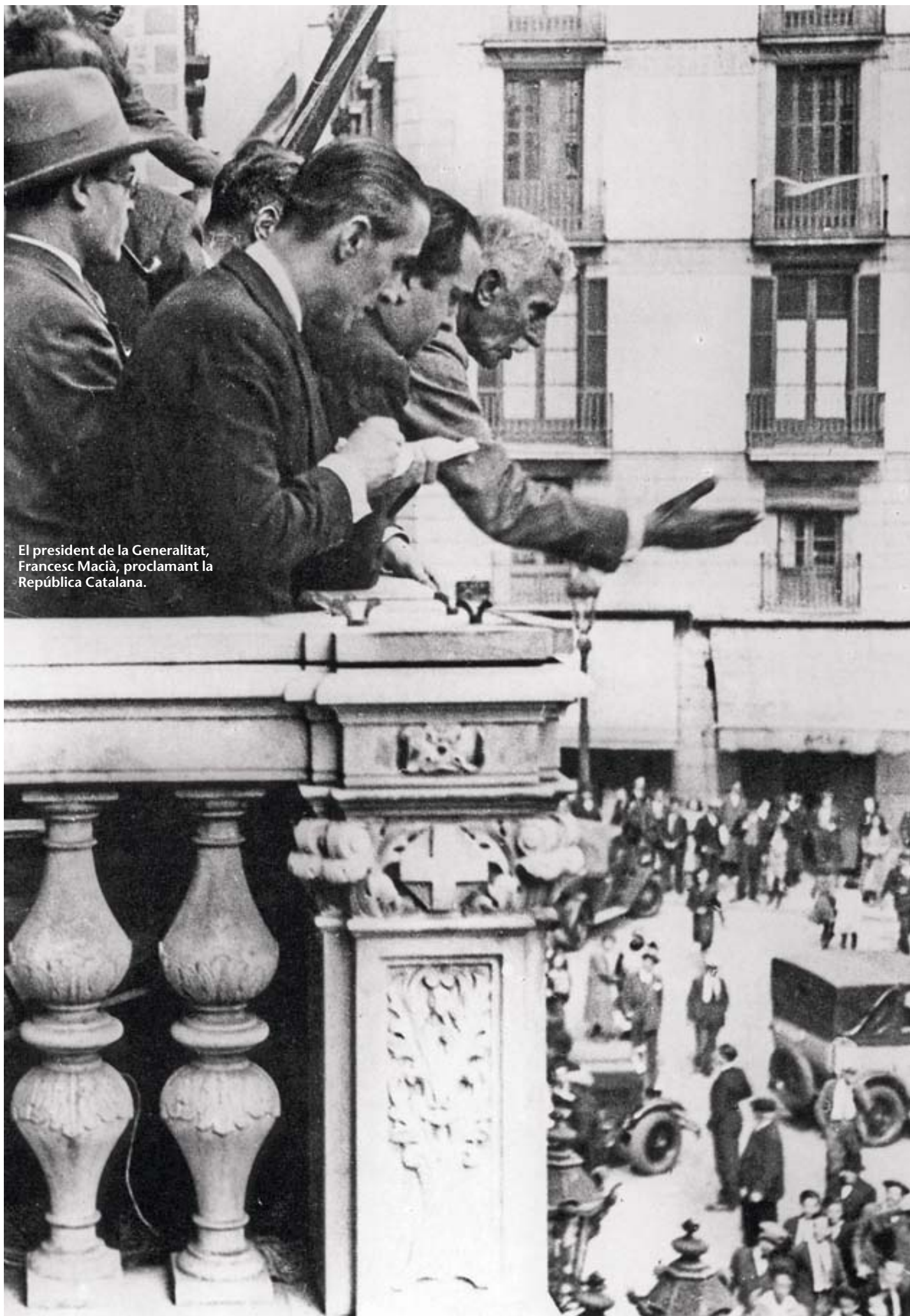
El president de la Generalitat, Francesc Macià, proclamant la República Catalana.