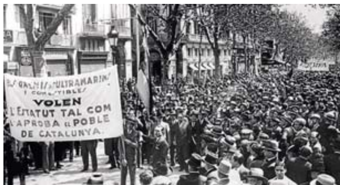
Manifestació a favor de l'Estatut, als anys trenta, a Barcelona.

dret que li són propis; mentre que l'Estat és una creació artificial fruit d'un procés polític.