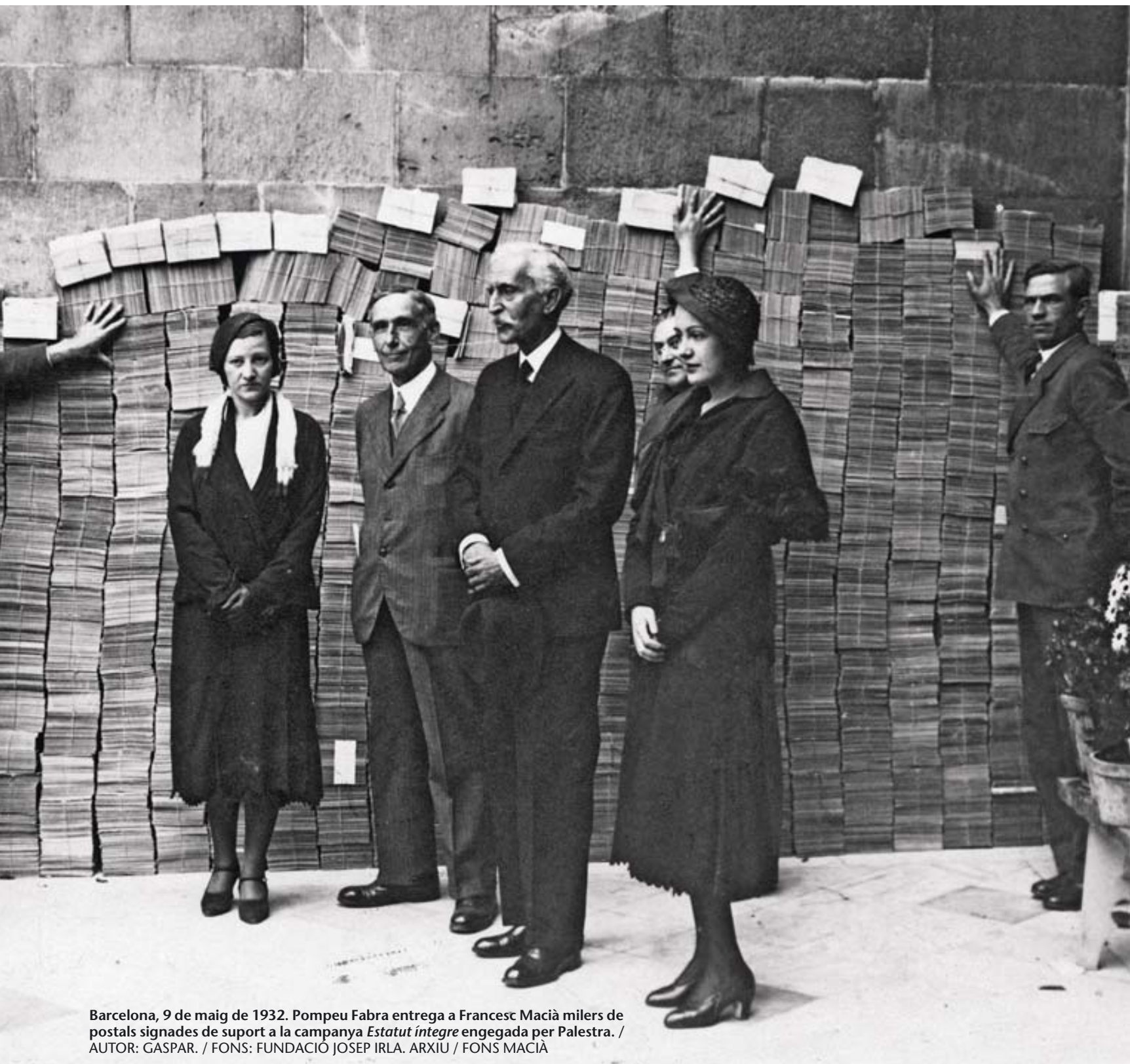
Barcelona, 9 de maig de 1932. Pompeu Fabra entrega a Francesc Macià milers de postals signades de suport a la campanya Estatut íntegre engegada per Palestra.