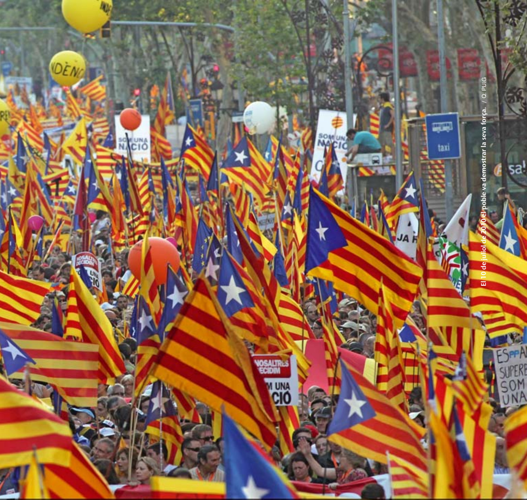
El 10 de juliol de 2010 el poble va demostrar la seva força.